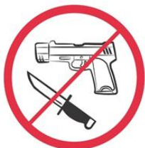
Broń, materiały wybuchowe, noże