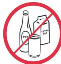
Butelki, puszki, kubki, dzbanki