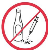
Napoje alkoholowe, narkotyki, substancje pobudzające, psychotropowe