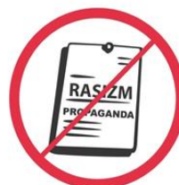
Materiały rasistowskie, ksenofobiczne, polityczne, religijne, propagandowe