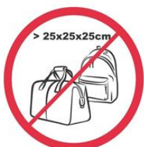
Pudła, torby, plecaki, walizki i inne przedmioty większe niż 25 cm x 25 cm x 25 cm