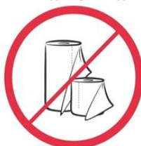
Duże ilości papieru