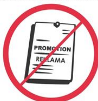
Przedmioty, materiały komercyjne i promocyjne