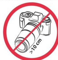
Profesjonalne aparaty fotograficzne, kamery wideo