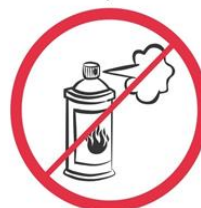
Gaz w aerozolu, substancje żrące, łatwopalne, barwniki