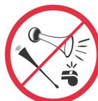
Megafony, syreny, urządzenia emitujące dźwięk