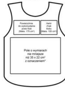
STANDARDOWE ZAGOSPODAROWANIE POWIERZCHNI -przód znacznika

*Napię koloru białego w jednym wierszu (PS TV, RP TV, TV, FOTO) o wysokości liter nie mniejszej niż 13 cm - font „Tahoma Bold” godz. wie. Najmiej. pow. liter: umieszczony numer porządkowy (001,002,003, 00) i o wysokości cyfr nie mniejszej niż 7 cm - font „Tahoma Bold” Napię koloru białego w dwóch wierszach (MEDIA KLUB) o wysokości liter nie mniejszej niż 8 cm - font „Tahoma Bold”