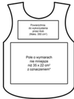
STANDARDOWE ZAGOSPODAROWANIE POWIERZCHNI -tył znacznika

*Napię koloru białego w jednym wierszu (PS TV, RP TV, TV, FOTO) o wysokości liter nie mniejszej niż 13 cm - font „Tahoma Bold” godz. wie. Najmiej. pow. liter: umieszczony numer porządkowy (001,002,003, 00) i o wysokości cyfr nie mniejszej niż 7 cm - font „Tahoma Bold” Napię koloru białego w dwóch wierszach (MEDIA KLUB) o wysokości liter nie mniejszej niż 8 cm - font „Tahoma Bold”