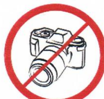
Profesjonalne aparaty fotograficzne, kamery wideo