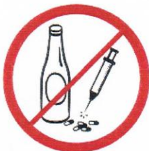
Napoje alkoholowe, narkotyki