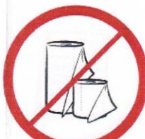
Duże ilości papieru