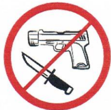
Broń, materiały wybuchowe, noże

Załącznik nr 1 do Regulaminu imprezy masowej - Oznaczenie zakazów obowiązujących podczas imprezy masowej organizowanej przez TS Podbeskidzie S.A.