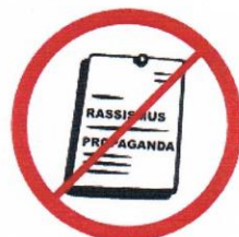
Materiały rasistowskie, ksenofobiczne, polityczne, religijne, propagandowe