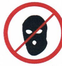
Części ubioru zakrywające twarz, kominiarki