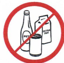
Butelki, puszki, kubki, dzbanki