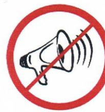
Megafony, syreny, inne urządzenia emitujące dźwięk