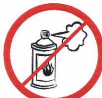
Gaz w aerozolu, substancje żrące, łatwopalne, barwniki