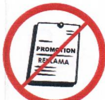
Przedmioty, materiały, ubrania komercyjne i promocyjne