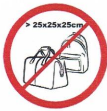
Pucla, torby, plecaki, walizki i inne wszelkie przedmioty większe niż 25 cm x 25 cm x 25 cm